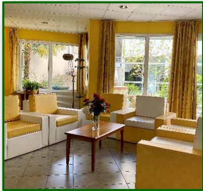
Salon jaune à l'accueil